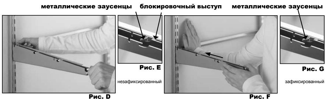
Рис. E показывает положение заусенцев до того, как их установили на место. Когда металлические заусенцы и бороздки совмещены, первый заусенец стоит на своем месте. Нажмите на рамку с задней округленной стороны до щелчка, устанавливающего её в правильное положение. (смотрите Рис. F и Рис. G). Следуйте той же процедуре с правой стороны.

Начинайте с левой стороны и внутренней части кронштейна. Направьте металлические заусенцы рамки "U"-формы в бороздки на кронштейне (Рис. D).